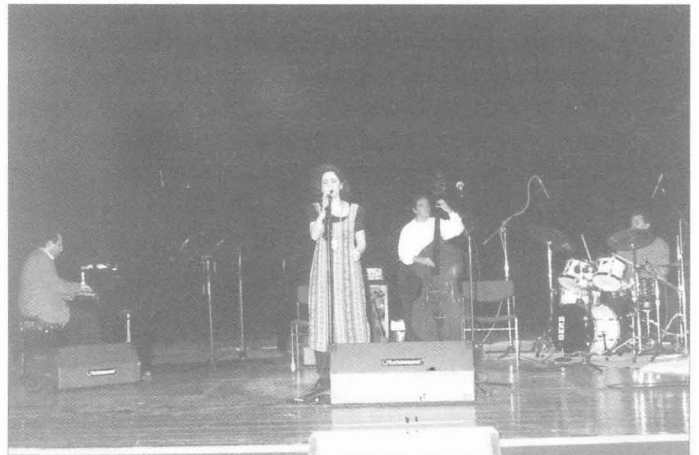
Presentación Teatro Centro Cultural Caixavigo (Vigo) "Nani García Cuarteto"