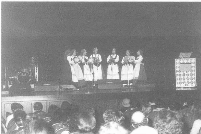
Presentación Teatro Rosalía de Castro (Coruña) "Cantigas e Agarimos"